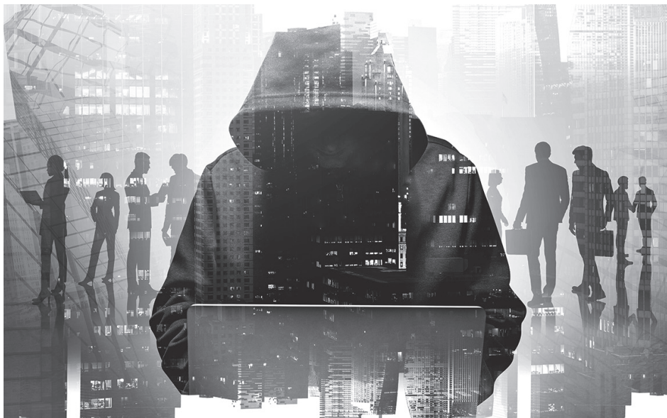
Схема с «угоном» аккаунта на портале «Госуслуги» приносит мошенникам ежегодно десятки миллиардов рублей.

У единого портала нет собственного функционала по оформлению кредита, но в большинстве кредитных организаций (банков и МФО) предусмотрена возможность авторизации клиента через портал «Госуслуги». Этим и пользуются мошенники.